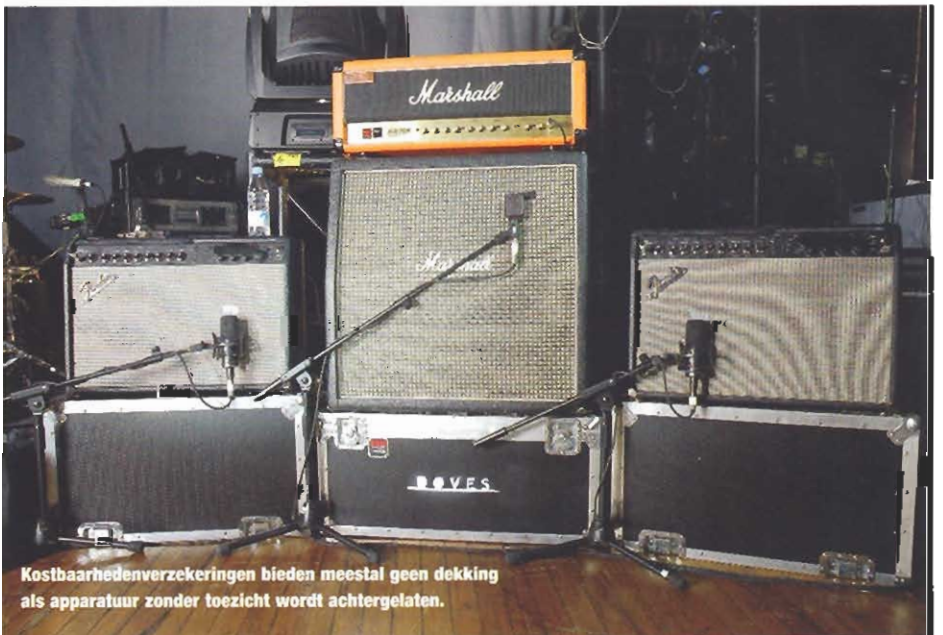
Kostbaarhedenverzekeringen bieden meestal geen dekking als apparatuur zonder toezicht wordt achtergelaten.