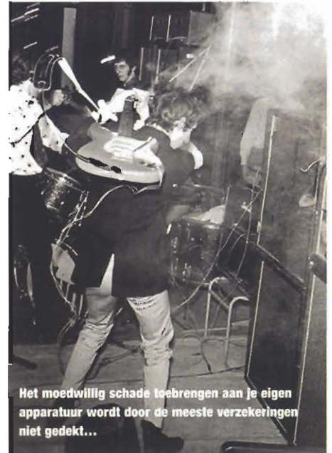
Het moedwillig schade toebrengen aan je eigen apparatuur wordt door de meeste verzekeringen niet gedekt...

Ook bieden kostbaarhedenverzekeraars meestal geen dekking als de instrumenten zonder direct toezicht van de eigenaar in een ver-