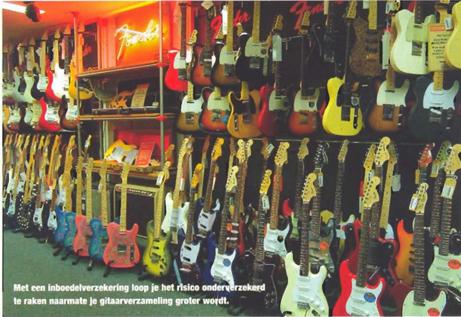
Met een inboedelverzekering loop je het risico onderverzekerd te raken naarmate je gitaarverzameling groter wordt.

zaken worden opgepakt en eindigt op het moment dat de zaken zijn aangekomen op de plaats van bestemming, maar kan worden uitgebreid met een verblijfsdekking voor, tijdens en na het optreden.