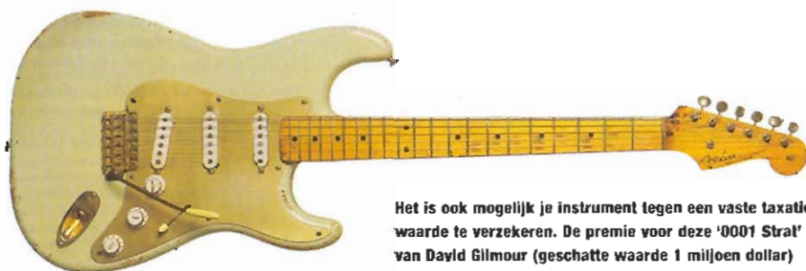
Het is ook mogelijk je instrument tegen een vaste taxatiewaarde te verzekeren. De premie voor deze '0001 Strat' van David Gilmour (geschatte waarde 1 miljoen dollar) moet dan wel astronomisch zijn!

Als je (semi-)professioneel met muziek bezig bent, zul je de muziekinstrumenten ook zakelijk moeten verzekeren en dat betekent dat je deze niet meer op een inboedelverzekering moet verzekeren. Dit kan dan op een kostbaarhedenverzekering of op een zogenaamde transportverzekering. Er zijn verschillende soorten transportverzekeringen, maar voor muzikanten is de doorlopende transportpolis - ook wel Pauschalpolis genoemd - met een all-riskdekking de geschiktste. Deze verzekering dekt beschadiging en verlies van vervoerde zaken tijdens het transport, waaronder het laden en lossen. De dekking begint normaliter op het moment dat de voor het vervoer bestemde